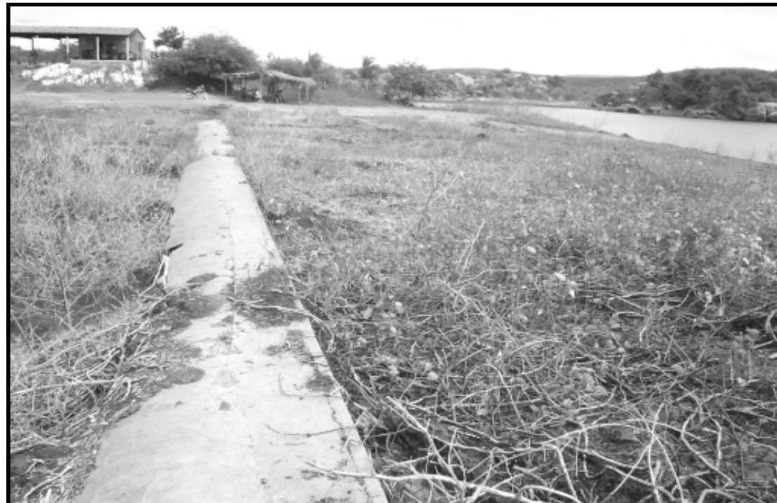
Água de Cachoeira ficou distante do sangrador este ano e perde um centímetro por dia