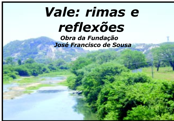
Capa em construção

A obra é um importante registro para a literatura regional e, ao mesmo tempo, uma fonte de incentivo e inspiração para novos valores da nossa poesia.