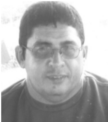
nosocômio disse que iria se inteirar do caso e depois se pronunciaria.